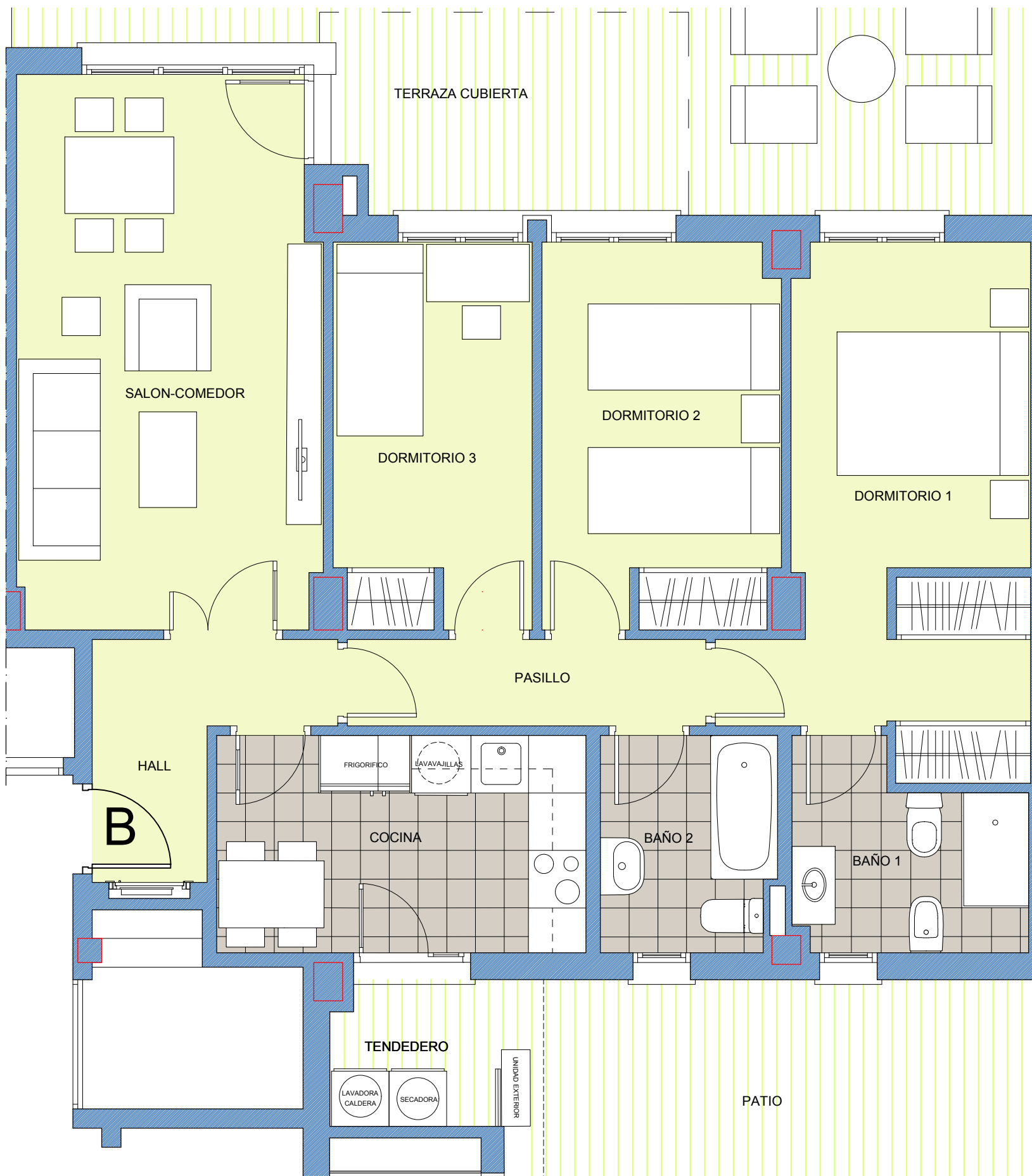
ESCALA: 1 / 50