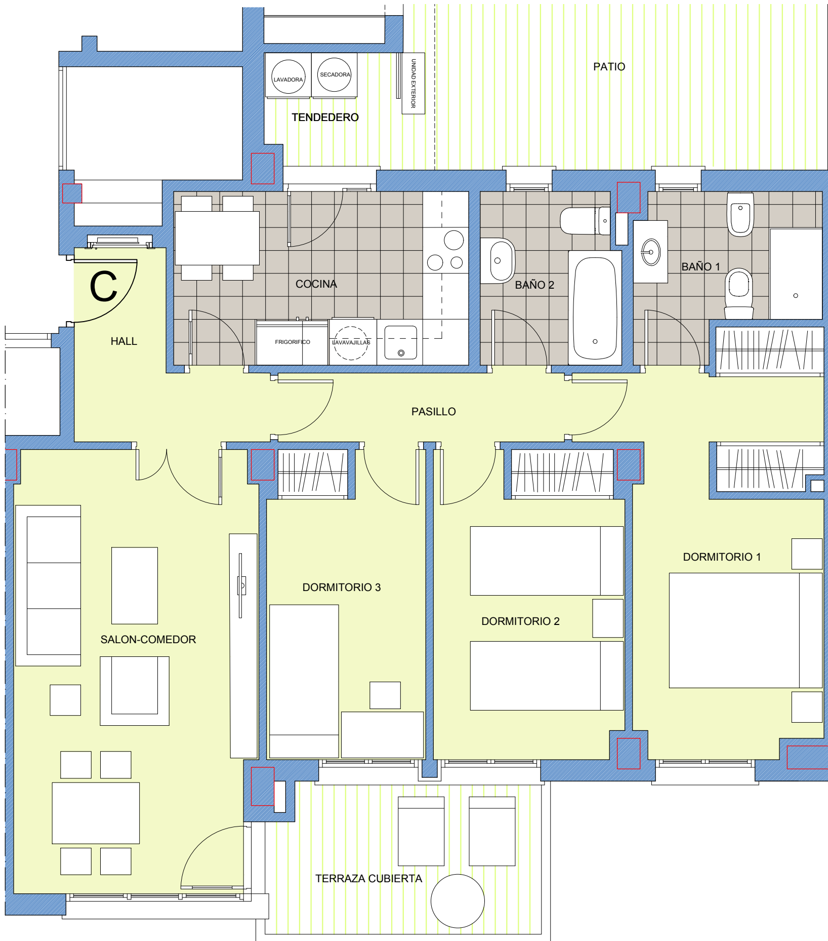
ESCALA: 1 / 50