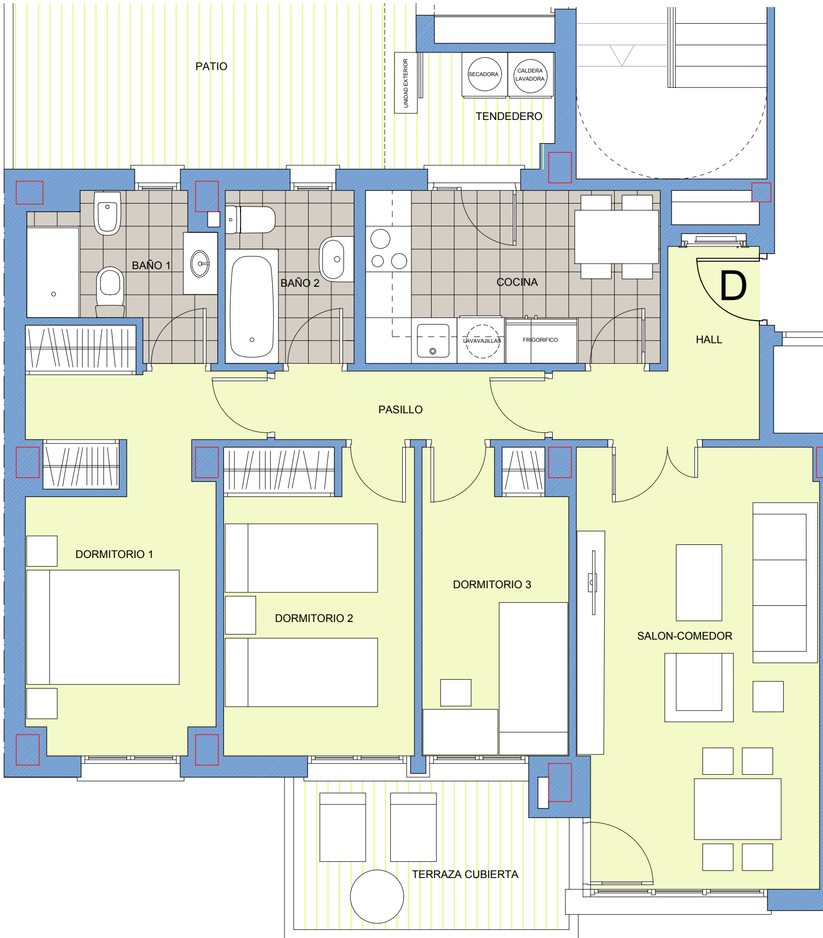
ESCALA: 1 / 50