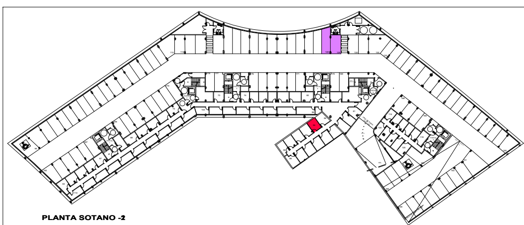
PLANTA SOTANO -2